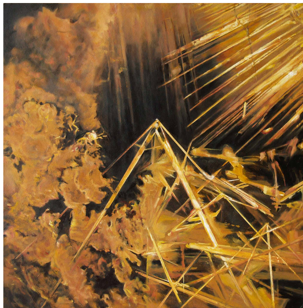
V slunci a větru, olej, sololit, 42 x 42 cm, 2019

tel.: 606 646 074 / e-mail: jan.m.jelinek@seznam.cz