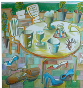
Wolfgang Herzer, Dancing to Heaven, 2015