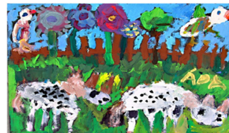
Adéla Tolmová, 6 let, Na pastvě 2015