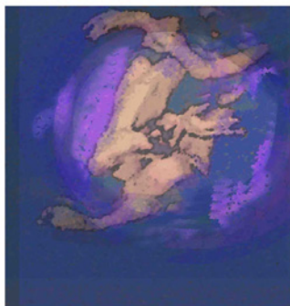
Petr Kozel, Bez názvu, 2015