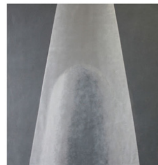
Milan Ďuriš, The dance of light, 2015