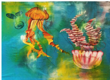
Laura Micciche, A dance with jellyfish, 2015