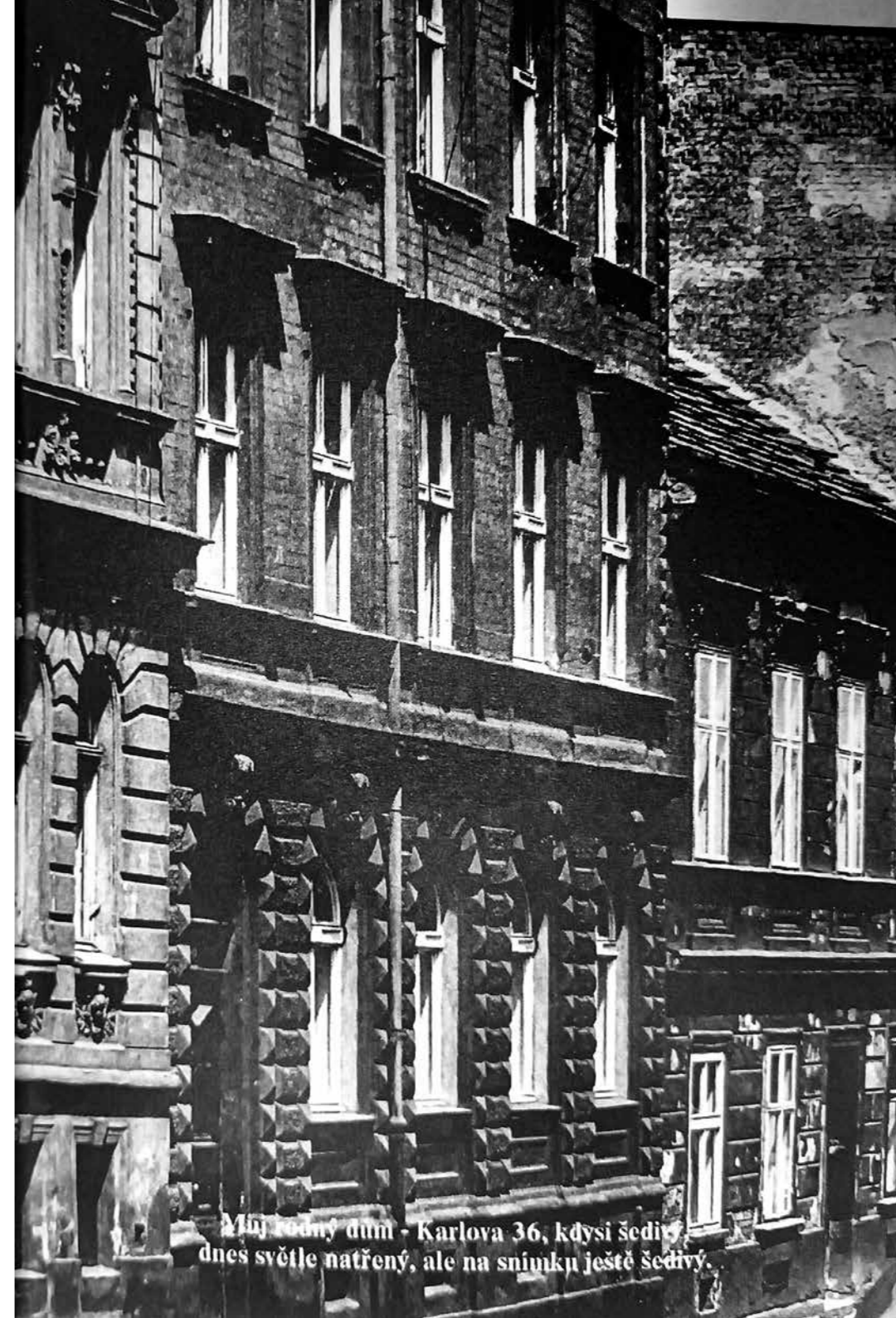
Můj rodný dům - Karlova 36, kdysi šedivý, dnes světle natřený, ale na snímku ještě šedivý.