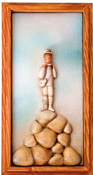
Já na vrcholu Luzného (Inspirován horolezcem R. Messnerem jsem se rozhodl dobýt vrchol osmi šumavských tisícovek.)